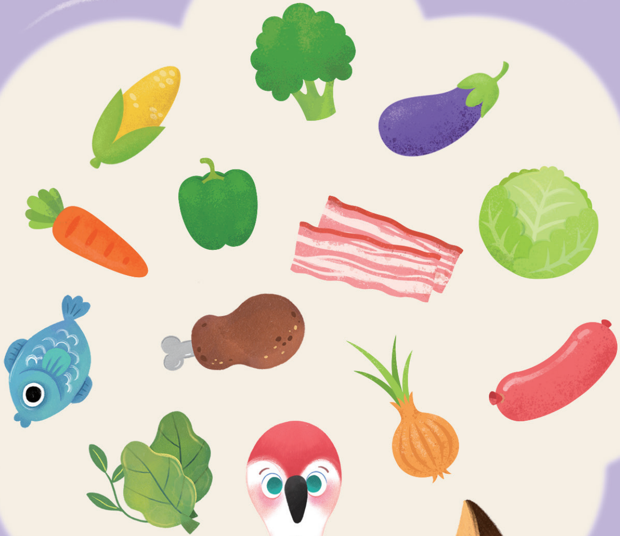
그림 속의 채소를 모두 세어보아요.